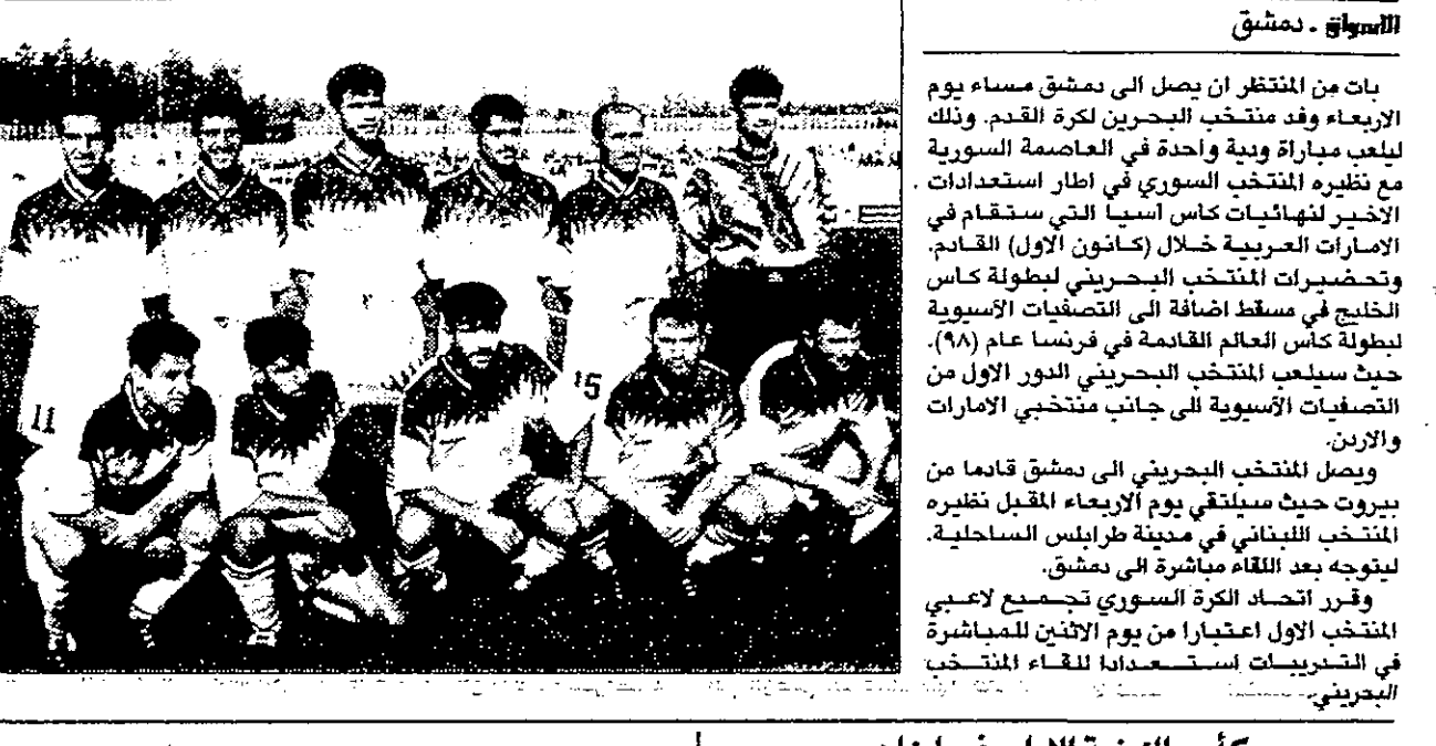
المنتخب السوري يلتقي نظيره البحريني بدمشق.. الجمعة

الاسواق - دمشق بات من المتوقع ان يصل الى دمشق مساء يوم الاربعة وفد منتخب البحرين لكرة القدم. وذلك ليلعب مباراة ودية واحدة في العاصمة السورية مع نظيره المنتخب السوري في اطار استعدادات الاخير لنهائيات كأس اسيا التي ستقام في الامارات العربية خلال (كأثون الاول) القادم. وتضمير المنتخب البحريني لبطولة كأس الخليج في مسقط اضافة الى التصفيات الآسيوية لبطولة كأس العالم القادمة في فرنسا عام (٩٨) حيث سيلعب المنتخب البحريني الدور الاول من التصفيات الآسيوية الى جانب منتخبي الامارات والاردن. ويصل المنتخب البحريني الى دمشق قريبا من بيروت حيث سيلتقي يوم الاربعة المقبل بنظيره المنتخب اللبناني في مدينة طرابلس الساحلية. ليتوجه بعد اللقاء مباشرة الى دمشق. وقر اتحاد الكرة السوري تجميع لاعبي المنتخب الاول اعتبارا من يوم الاثنين للمباراة في التدريبات استعدادا للقاء المنتخب البحريني.